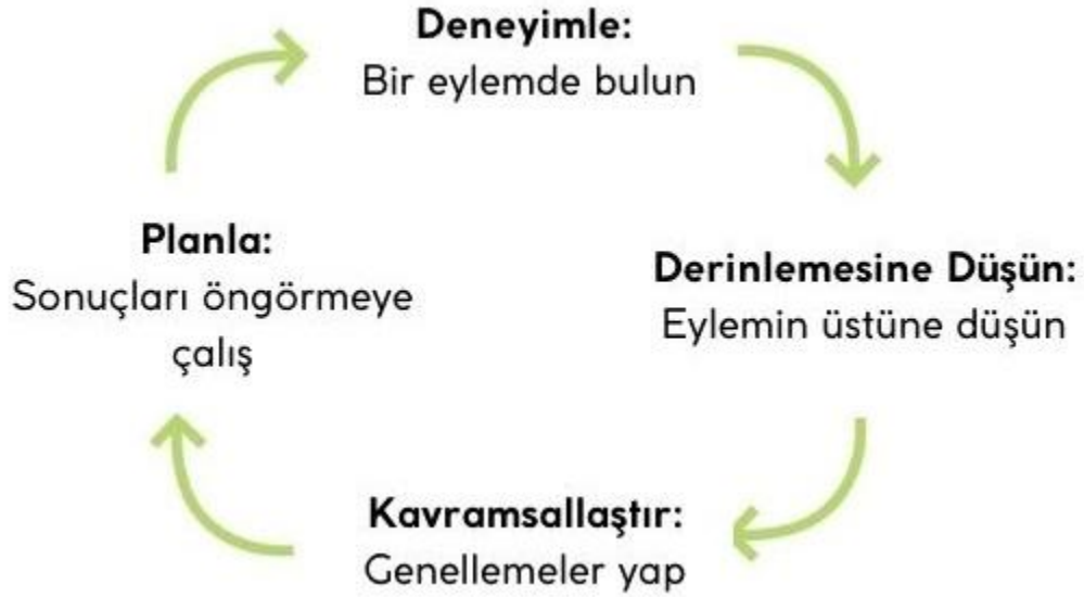
Tablo 1: Kolb'un Öğrenme Döngüsü 10

öğrenme biçimi olmak üzere iki düzeyde ayrıntılandırdı. Kolb'un teorisi temel olarak öğrencinin bilişsel süreçleriyle ve yeni deneyimlerin yeni kavramlar geliştirmesiyle ilgilidir. Etkili öğrenme, dört aşamalı bir döngüyle gerçekleşir: (1) somut bir deneyim yaşamak, ardından (2) bu deneyimin gözlemlenmesi ve üzerinde derinlemesine düşünülmesi , (3) soyut kavramların (analizin) ve genellemelerin (sonuçların) oluşumuna yol açar ve bunlar (4) gelecek yaşantıda etkin olarak tecrübe edilir ve böylece yeni deneyimler ortaya çıkar.